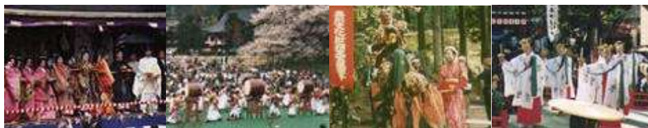
飛騨生きびな祭り(高山市) | 臥龍桜まつり(高山市) | 金蔵獅子(高山市) | 飛騨神岡まつり(飛騨市)