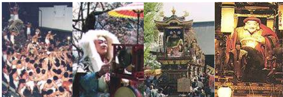
飛騨古川祭(飛騨市) | 全日本チンドンコンクール(富山市) | 曳山祭り(富山市) | 曳山祭(南砺市)