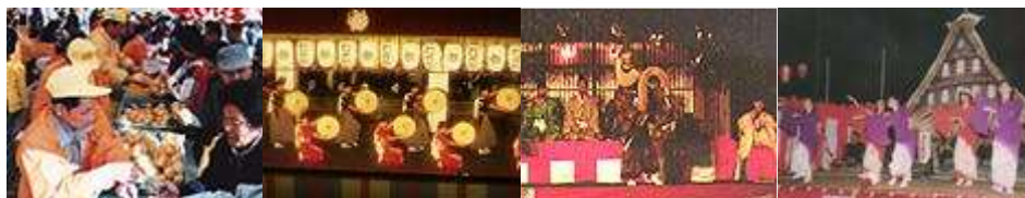
ゆずまつり(砺波市) | むぎや祭(南砺市) | こきりこ祭り(南砺市) | お小夜まつり(南砺市)