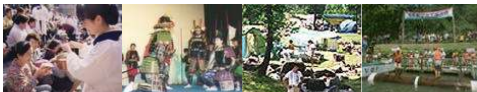
どぶろく祭(白川村) | 佐々成政戦国時代祭り(大山町) | 有峰森林文化村祭り(大山町) | 庄川水まつり(砺波市)