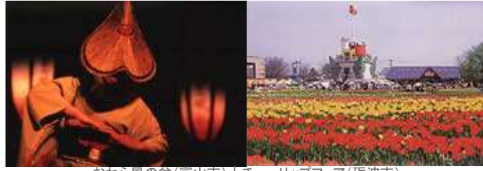
おわら風の盆(富山市) | チューリップフェア(砺波市)