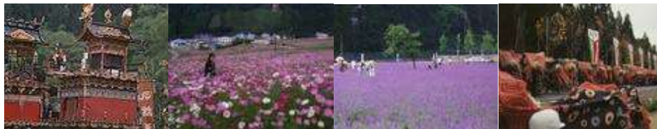
高山祭(高山市) | コスモスまつり(高山市) | ひだ清見ラベンダーまつり(高山市) | 飛騨荘川ふるさと祭り(高山市)