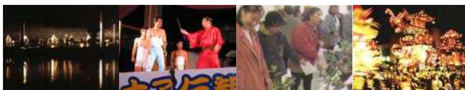
利賀フェスティバル(南砺市) | いなみ太子伝観光祭(南砺市) | いのくち椿まつり(南砺市) | 夜高祭(南砺市)